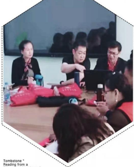
Tombstone * Reading from a