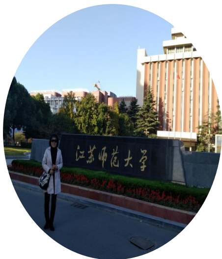
辽宁省抚顺市第二十六中学