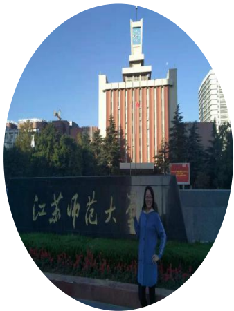
宁夏吴忠开元小学